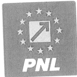
SIGLA PARTIDULUI NAȚIONAL LIBERAL

Sigla reprezintă Partidul Național Liberal și susține prin coerență și claritate mesajele, credințele și valorile de care această organizație politică le promovează, și anume: democrație, libertate, transparență, naționalism, progres, prosperitate, pluralism, modernizare .