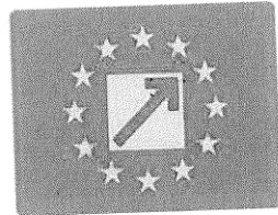
SIMBOLUL GRAFIC AL PARTIDULUI NAȚIONAL LIBERAL

Logo-ul este cel mai utilizat element din identitatea vizuală.