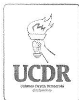
Anexa 1 b) – sigla UCDR alb-negru.

Extras din fila 36/verso a dosarului nr. 30164/3/2020 - Tribunalul București – Secția a IV - a Civilă reprezentând sigla Partidului Uniunea Creștin Democrată din România – UCDR (document scanat):